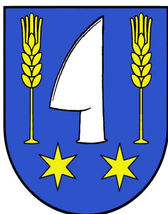
ĚRB MESTSKEJ ĀASTI VEĀKĚ BEDZANY