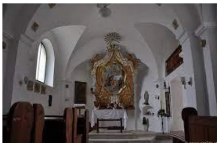
pohľad na oltár

Kostolík sv. Štefana kráľa je fakt pekný, čistý, nachádza sa v ňom veľa zaujímavých predmetov. Kostolík má dva chóry s dreveným zábradlím, ku ktorým vedú drevené schodíky.