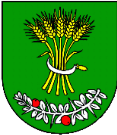
Erb obce :