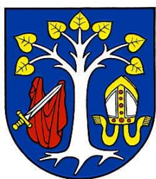
Erb obce Martinček

má medzi ostatnými symbolmi obce osobitné postavenie. Je vlajkou starostu, jedným z odznakov jeho úradu. Podobá sa znakovkej zástave, je však doplnená o lem vo farbách vlajky obce.