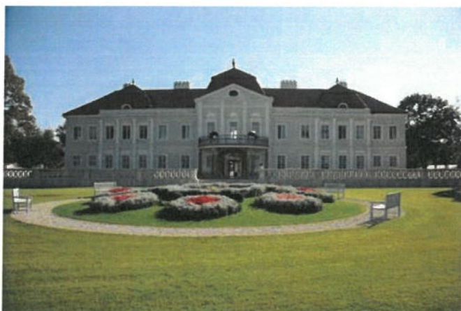
Obrázok 1 Barokový kaštieľ Majorháza

Za budovou barokového kaštieľa bol založený park na počesť kráľovnej Alžbety nazývaný ako Alžbetina záhrada. Ide o rozsiahly a pomerne dobre zachovaný anglický park.