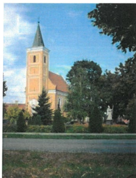
Obrázok 2 Kostol sv. Mikuláša