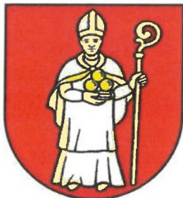
Obrázok 5 Erb obce Tomášov

Symbolmi obce sú erb, vlajka a pečat'. V červenom štíte je biskup - svätý Mikuláš - v striebornom zlatolemom rúchu, v pravici pred sebou s troma zlatými guľami na striebornej položenej knihe, v ľavici so zlatou berlou.