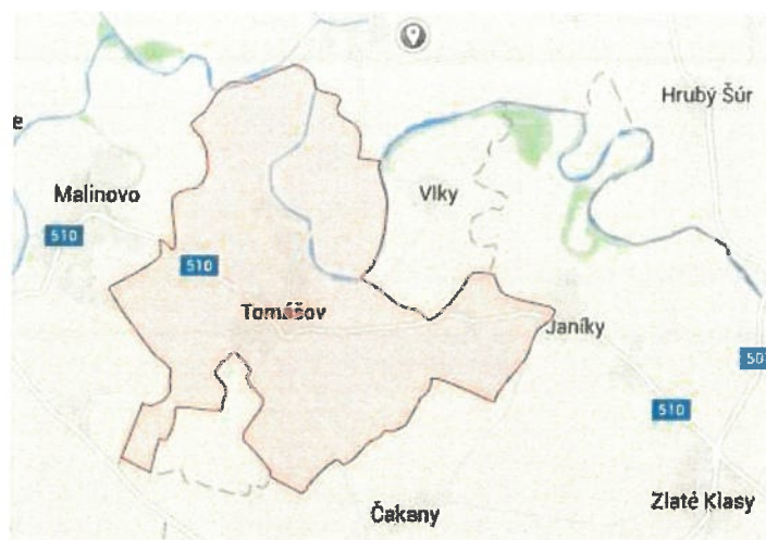
Obrázok 7 Geografická poloha obce Tomášov