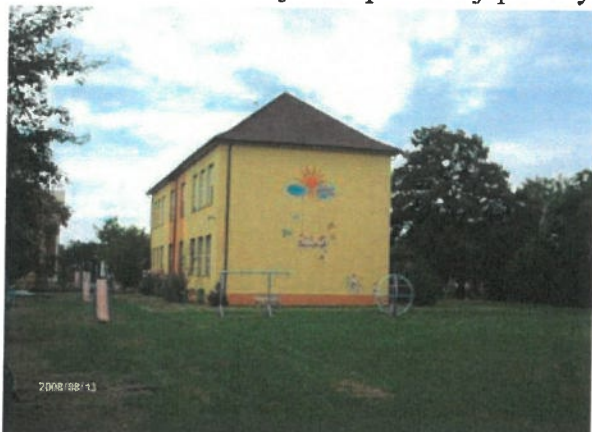
Obrázok 3 Budova pôvodnej ľudovej školy

Kaplnka sv. Kríža je neogotická stavba z konca 19. storočia. Okolo roku 1965 vyhorela a obnovili ju do pôvodnej podoby. Kaplnka v súčasnosti slúži ako dom smútku.