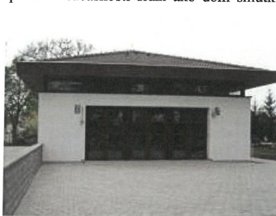
Obrázok 4 Kaplnka sv. Kríža