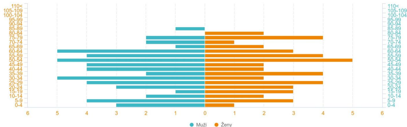
Veková štruktúra obyvateľstva k 31. 12. 2023 (osoby podľa vekových skupín)