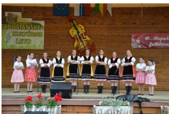
Speváčky FS Kapušančan

19. ročník Kapušianskych folklórnych slávností sa konal 15.06 – 16.06.2024 na amfiteátri v Parku sv. Cyrila a Metoda. Program bol pestrý. Predstavili sa domáce zoskupenia: FS Kapušančan, SZUŠ v Kapušanoch, DFS Čerešenka, MSS Kapušanske Richtarose, ale aj hostia ako FS Zobor, FS Štěpnička z Českej republiky, FS Šarišan a iné.