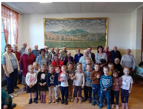
Úcta k starším v Dennom centre