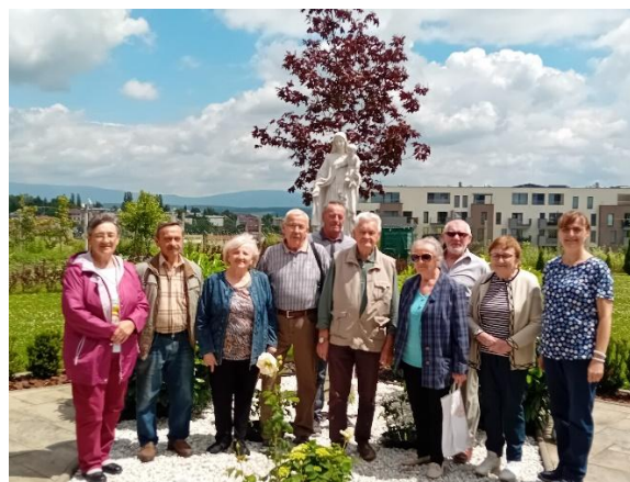
Výlet v Košiciach