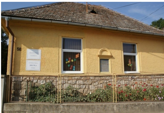
Budova školy a škôlky

Na základe analýzy doterajšieho vývoja možno očakávať, že rozvoj vzdelávania sa bude orientovať na skvalitňovanie výchovno – vzdelávacieho procesu.