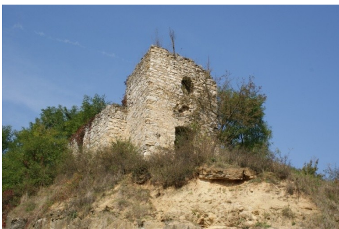
Kaplnka Andreja apoštola

Najvýznamnejšou pamiatkou obce je kaplnka sv. Andreja apoštola postavená v eklektickom historizujúcom slohu. Nachádza sa na skrasovatenom brale nad miestnou základnou školou.