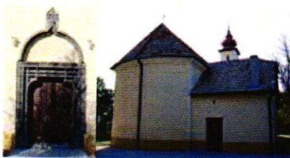
Kostol s runovým písmom

Presné datovanie kostola nepoznáme, je však pravdepodobné, že prvý tu stál už v 13 storočí. V 15 storočí sa budova dnešného kostola viackrát prestavala a "skoro úplne stratila pôvodný tvar". Kostol však zostal na pôvodnom mieste a v južnej časti steny starej lode i portál.