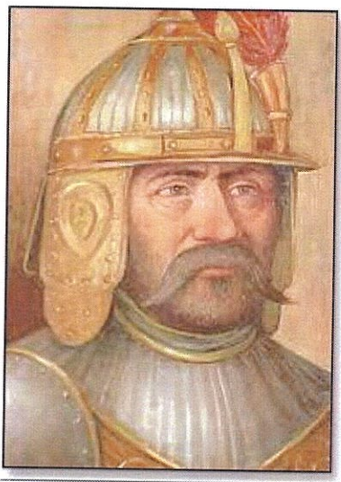
Významní rodáci, osobnosti obce: