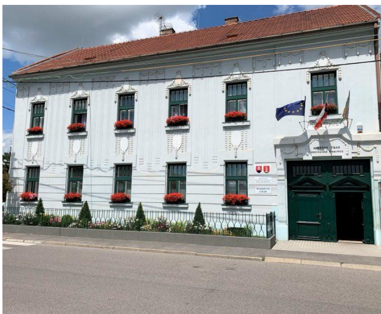
Obrázok č. 1 Miestny úrad mestskej časti Bratislava - Podunajské Biskupice na Trojičnom námestí 11.