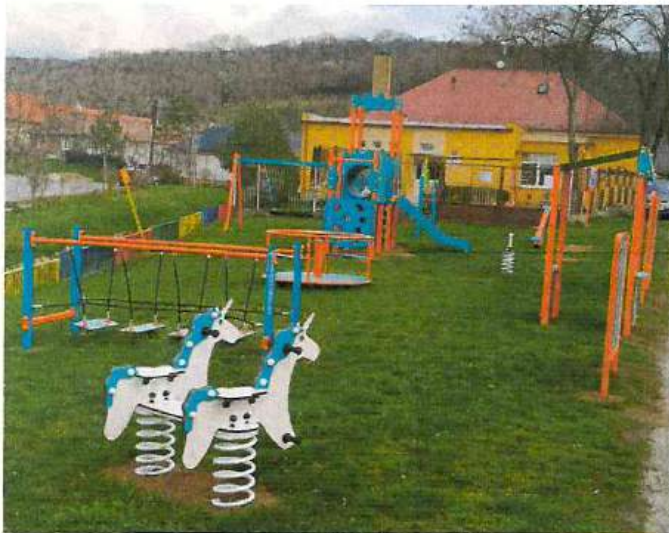
Obrázok 2: Detské ihrisko pri MŠ