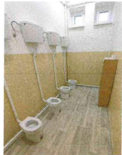
Obrázok 3: Zrekonštruované toalety v MŠ

V roku 2024 boli zrekonštruované sociálne zariadenia v budove materskej školy tak, aby vyhovovali potrebám škôlkarov a hygienickým štandardom. Rekonštrukcia bola financovaná z vlastných zdrojov obce. Zrekonštruovaná bola podlaha, osadené boli nové WC misy, miestnosť bola vymaľovaná.