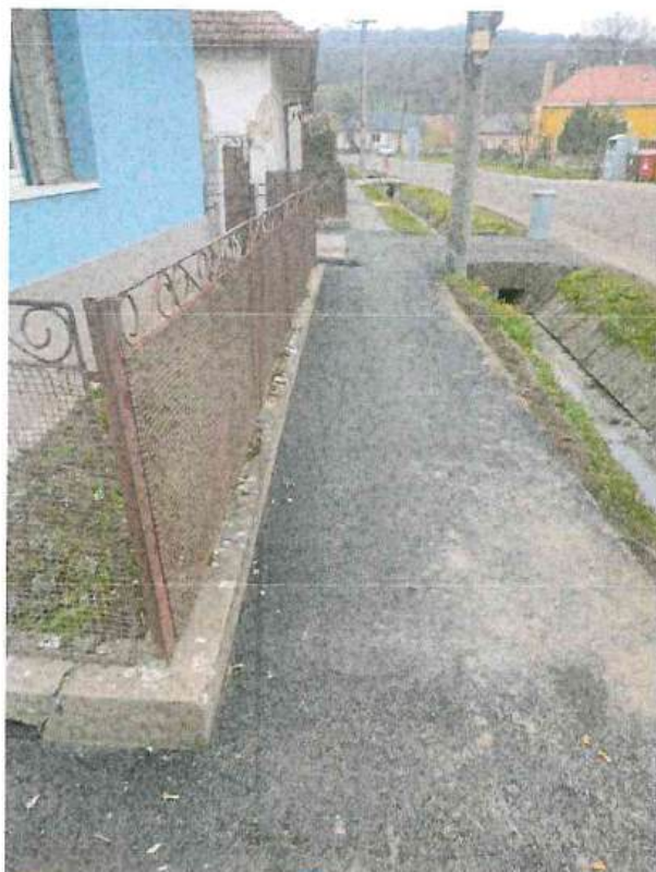
Obrázok 4, 5, 6: zrekonštruované chodníky

V roku 2024 obec zrekonštruovala 130m chodníkov a ciest, časť nákladov bola pokrytá z grantu od Nitrianskeho samosprávneho kraja Obnova verejného priestranstva v sume =5000€ a z vlastných zdrojov =8.000,-€. Pre obchodnou prevádzkou COOP Jednota bol vybudovaný stojan pre bicykle a zrekonštruovaných bolo aj niekoľko príjazdových mostíkov.