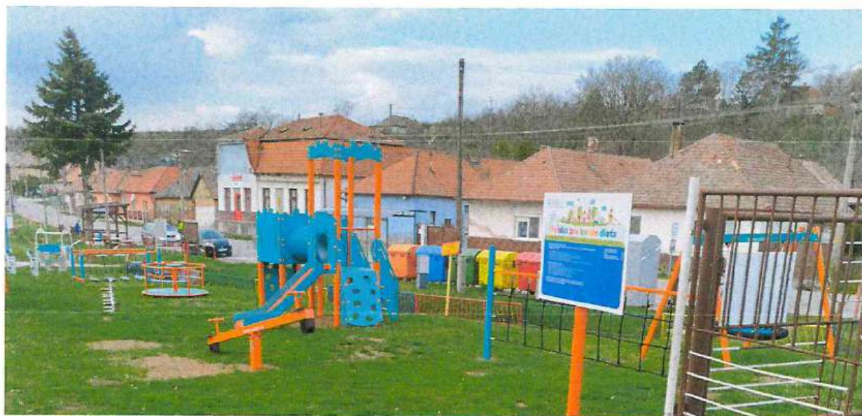
Obrázok 1: Detské ihrisko pri MŠ

V roku 2024 bolo novo postavené detské ihrisko pri budove materskej školy. Dotáciu na projekt poskytlo Ministerstvo práce, sociálnych vecí a rodiny SR vo výške =27500€. Obec sa na financovaní podieľala spoluúčasťou =3500,-€. Detské ihrisko bolo uvedené do používania v roku 2025.