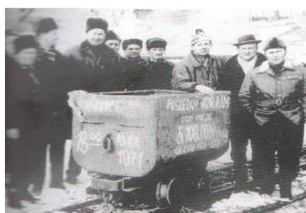
Posledný vagón s rudou vyvezený z bane