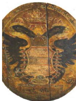
Vývesný štít pošty v Hôrke