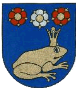
Vlajka obce :