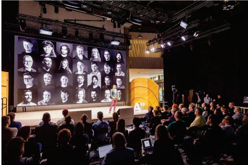
Aalto University in Espoo, Finland Produkty: Planar Venue Pro VX Series 1.9 Výmera obrazoviek: 27 m 2

Počas roku 2024 skupina realizovala projekty v zahraničí zamerané na rôzne vertikálne trhy.