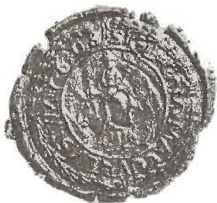
Pečat' obce z roku 1608

Pečat': Vychádza z erbu a v kruhopise má nápis: OBEC PODHORANY