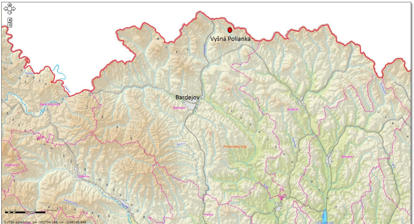
Mapa č.1: Geografická poloha obce v rámci okresu Bardejov