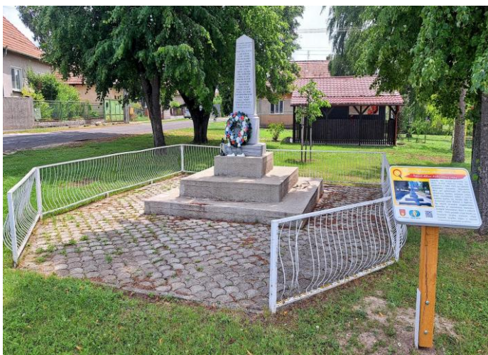
Pomník obetiam 2. svetovej vojny

Zvonica je reprezentantom ľudovej murovanej stavby. Bola postavená v roku 1876. Zvon, ktorý je v nej umiestnený, pochádza z 19. storočia. Rekonštrukciou, ktorú realizovalo občianske združenie Zoulus, nadobudla pôvodnú podobu. Taktiež aj v roku 2024 OZ Zoulus dokončilo chodník okolo zvonice.