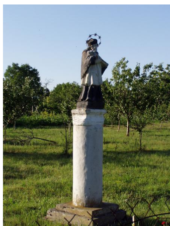
Socha svätého Jána Nepomuckého