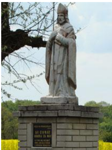
Socha svätého Donáta