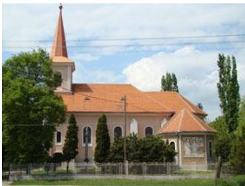
Rímskokatolícky kostol z r.1892