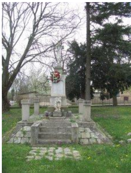
Pomník Obetiam 1. a 2 svetovej vojny

nachádza pomník pripomínajúci pohnuté udalosti na sklonku druhej svetovej vojny, a tiež časy, v ktorých bol vtedajší Dolný Síleš a Horný Síleš súčasťou Maďarského kráľovstva. Súčasný pomník bol vyhotovený v roku 2019 a nahradil tak svojho predchodcu z roku 1984.