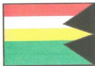
Vlajka obce :