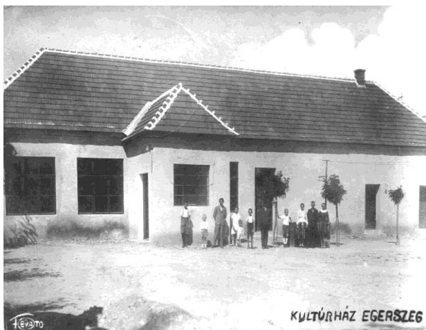
Kultúrny dom kedysi

Najnavštevovanejším podujatím v obci sú Jánske ohne spojené s posedením pri hudbe, chutným občerstvením a zapálením vatry, ktoré prebiehajú v prírode v priestoroch Šibeje parku. Obnovila sa aj súťaž vo varení gulášu. Do povedomia občanov sa postupne dostáva aj stavenie mája pri hasičskej zbrojnici a spievanie vianočných kolied spojené s príchodom sv. Mikuláša pre najmenších.