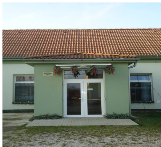
a dnes ...