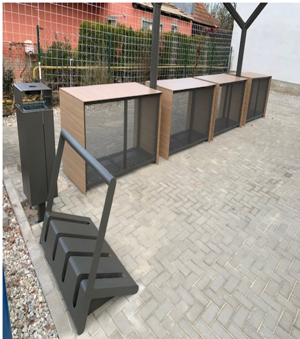
Trhovisko - revitalizácia