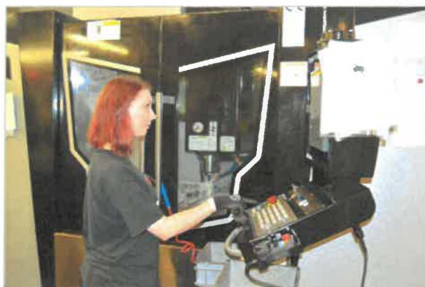
Moderná fréza VMC 1000 obsluhovaná skúsenými zamestnancami spoločnosti Global Industrial Parts, s.r.o.