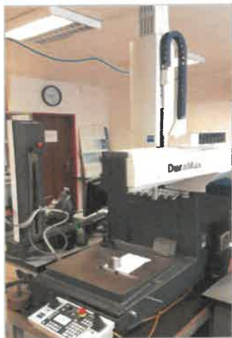
3D TOUCH PROBE, CMM, Zeiss, využívaný na kontrolu výrobkov

Unikátne technologické riešenia, vysoká profesionalita inžinierov a spolupráca so svetovými lídrami vo výrobe obrábacích nástrojov umožňuje dosahovať mikrónové presnosti pri opracovaní státisícových sérií výrobkov. Rozsah obrábaných výrobkov je od 1 g do 100 kg, rozmerovo od 1 mm do 1000 mm. Z hľadiska sériovosti od 1 kusa po 10 miliónov kusov, pričom viac druhov výrobkov je vyrábaných súbežne.