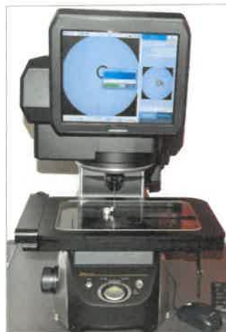
2D LIGHT TOUCH PROBE, Keyence, povyžívaný na kontrolu výrobkov

Firma má možnosť kontrolovať kvalitu obrobených výrobkov s presnosťou na 1 mikrón ( \mu\text{m} ), pričom to dokáže vykonať priamo v sériovej výrobe. CNC stroje s vysokou presnosťou a automatickou korekciou parametrov obrábania umožňujú dosahovať maximálnu stabilitu procesu obrábania.