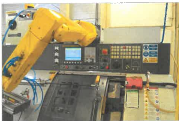
Robotizované pracoviská sú rovnako súčasťou sústruhov

Spoločnosť Global Industrial Parts, s.r.o. zároveň výrazne investuje do automatizácie a robotizácie svojej výroby v zmysle Industry 4.0.