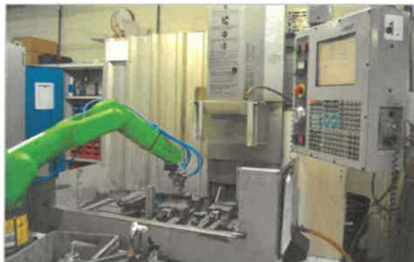
CNC fréza s kolaboratívnym robotizovaným pracoviskom v spoločnosti Global Industrial Parts, s.r.o.

Spoločnosť disponuje modernými sústruhmi a frézami najnovšej generácie. Vďaka širokej škále ponúkaných služieb je pripravená vyhovieť svojim zákazníkom v širokom spektre mechanického opracovania výrobkov vyrobených z rozličným materiálom, od dielov zhotovených napríklad práškovou metalurgiou, vstrekovaním kovových práškov, odlievaním a pod.