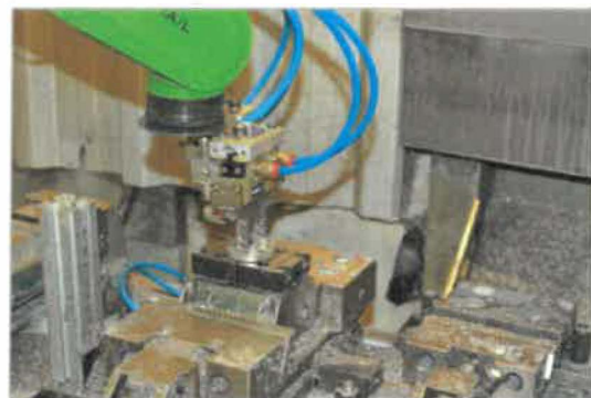
Robot podáva a odoberá kusy, čím sa zrýchľuje a zefektívňuje celý proces frézovania