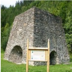
Vysoká pec v časti Tri Vody

Obec Osrblie sa môže pochváliť pamiatkami: