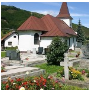
Rímskokatolícky kostol Navštívenia Panny Márie s drevenou plastikou z druhej polovice 15. storočia