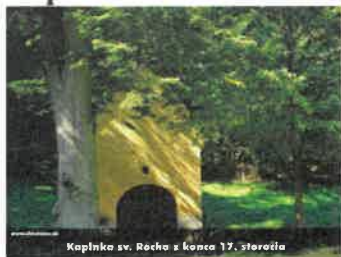
Kaplnka sv. Rócha z konca 17. storočia

Národná kultúrna pamiatka, č. NKP 889, kaplnka, lokalita Chtelnica. Kaplnka sa nachádza v prekrásnom horskom údolí obklopenom malokarpatskými lesmi, vzdialenom asi pol hodiny cesty na severozápad od obce pri prameni čistej horskej vody. Každoročne po stáročia sem putovali obyvatelia Chtelnice slávnostne v procesii s hudbou, cechovými i kostolnými zástavami a s nimi aj obyvatelia z okolia.