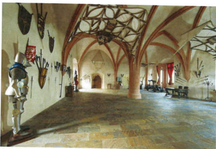
Obrázok 2: Velká rytierska sála

Veľmi obľúbeným priestorom je aj nočný Dragon bar , kde si naši hostia môžu užiť pokojný večer pri pohárikú kvalitného koňaku alebo vychutnať cigary svetových značiek.