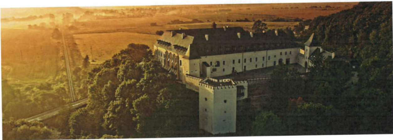
Obrázok 1: Hotel Grand Víglaš****

História Zámku siaha do 13. storočia, kedy bol kláštorným objektom. Na Zámku sa vystriedali viacerí panovníci ako Žigmund Luxemburský, Matej Korvín a ďalší. Zámok bol počas 2. svetovej vojny poškodený a z veľkej časti vyhorel. V roku 2007 zručaniny Zámku odkúpila spoločnosť Zámok Víglaš s.r.o., ktorá začala, pod dohľadom odborníkov z pamiatkových úradov, realizovať projekt ich obnovy, ktorý bol spolufinancovaný zo zdrojov Európskej únie.