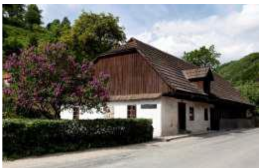
Obrázok 8 Rodný dom J.G. Tajovského