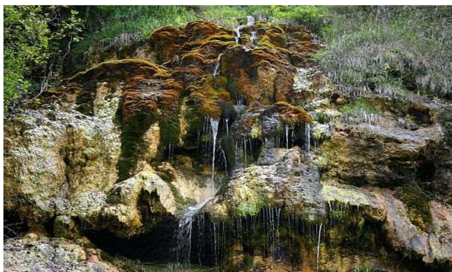
Obrázok 10 Tajovská kopa

V zozname kultúrnych pamiatok je evidovaný kostol sv. Jána Krstiteľa (1592), rodný dom Jozefa Gregora Tajovského (1799) a rodný dom Jozefa Murgaša. V časti Kopanice sa nachádza chránený prírodný útvar „Tajovská kopa“, na ktorej je postavený obecný vodojem (1929).