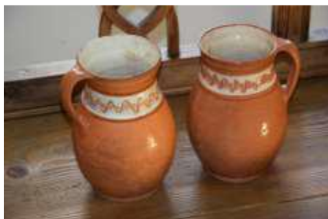
Obrázok 3 Hrnčiarske výrobky z Tajova