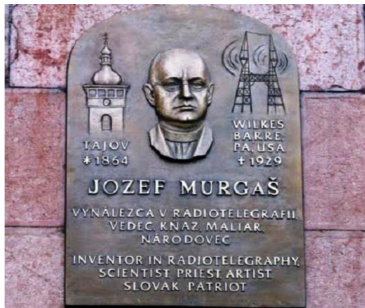
Obrázok 12 /1/2 Jozef Murgáš