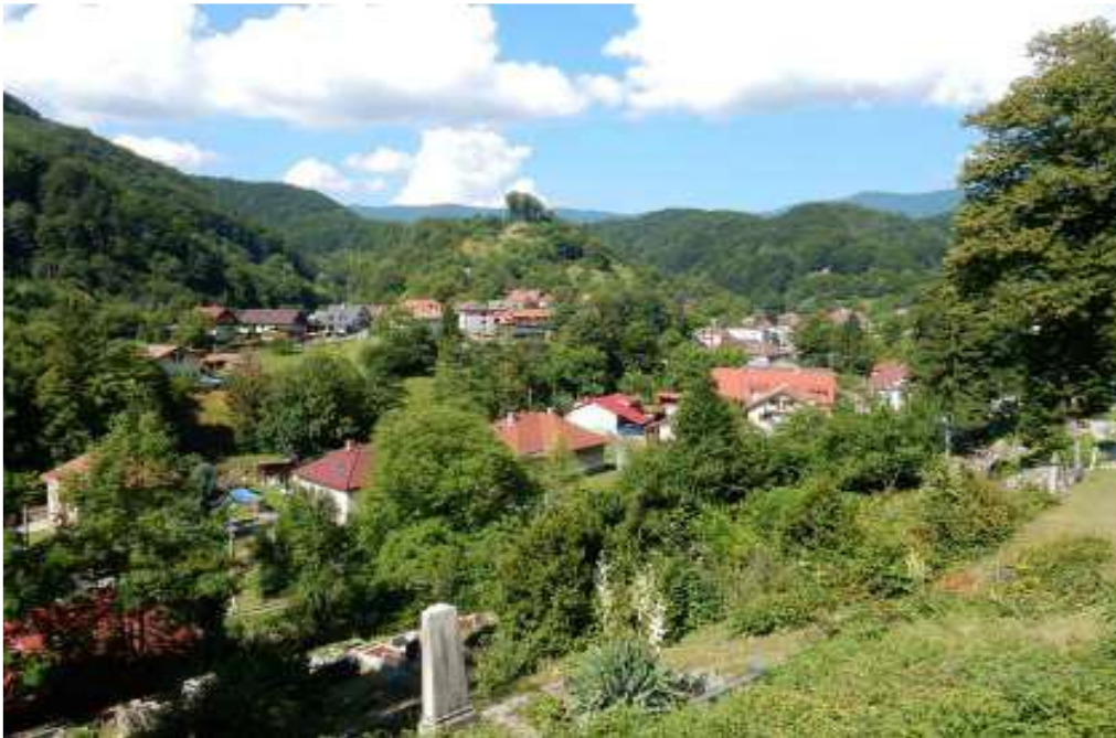
Obrázok 2 Obec Tajov 1

Obec Tajov vznikla asi v 15. storočí, na území rodiny Radvanských a rozšírila sa v roku 1496 – 1500, kedy Ján Thurzo vybudoval dve huty – hornú a dolnú, na čistenie medi. Huty sa stali súčasťou banskobystrického mediarskeho podniku. V 16. storočí zamestnávali 70 – 100 robotníkov (vrátane uhliarov a povozníkov). Aj keď sa výroba v hutách od druhej polovice 16. storočia obmedzovala, prevádzka sa v nich udržala do roku 1893. Po likvidácii hút Tajov nemohol poskytnúť náhradné pracoviská všetkým robotníkom. Väčšina sa zamestnala v priemyselných podnikoch na okolí – v papierni v Harmanci, v Medenom Hámri v Banskej Bystrici, v Banskej Štiavnici. Okrem toho, pri každom dome v obci, bolo menšie hospodárstvo, ktoré viedli prevažne ženy. Lúky a pasienky umožňovali chov dobytky a oviec, s čím súvisela výroba črpákov, spracovanie vlny a pletenie kapcov. Vyrábali sa tu aj svojrázny hrnčiarsky riad.