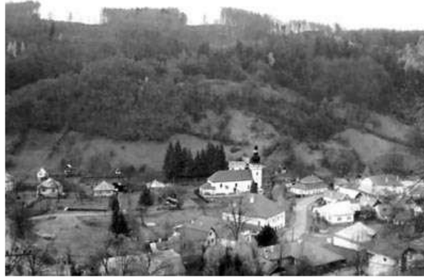
Obrázok 4 Obec Tajov 2

Rozloha chotára obce bola 736 ha. Po zlúčení so susednou obcou Jabříková, ktorú od Tajova oddeľoval Králický potok, 1. januára 1943, je celková rozloha chotára 932 ha. Školu v Tajove založili jezuiti v roku 1657 a trvala nepretržite do konca školského roku 1978/79. Po zrušení druhej triedy základnej školy, v roku 1951, sa uvoľnili dve miestnosti v budove obvodného notariátu, čím sa naskytla príležitosť na založenie materskej školy pre deti od troch do šiestich rokov, s dopoludňajšou prevádzkou. Prestavbou prízemnia tejto budovy, sa v roku 1963 vytvorili podmienky na materskú školu s celodennou prevádzkou, ktorá trvá dodnes.