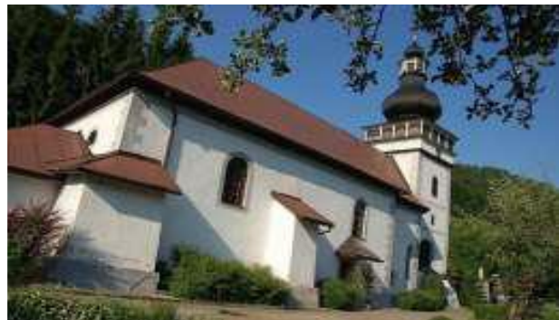
Obrázok 6 Rímskokatolícky kostol sv. Jána Krstiteľa