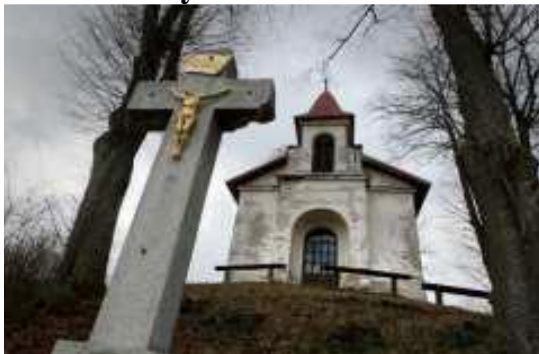
Obrázok 5 Kalvária v Tajove