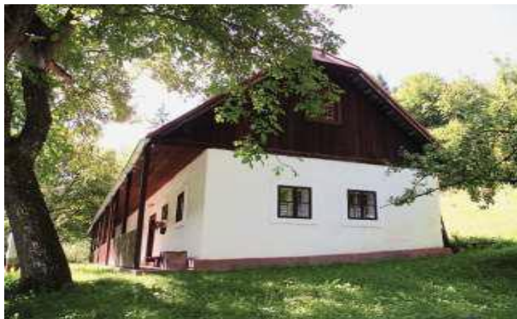
Obrázok 7 Dom Jozefa Murgaša v Tajove