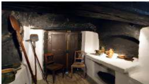
Obrázok 9 Expozitúra v rodnom dome J. G. Tajovského

V zozname kultúrnych pamiatok je evidovaný kostol sv. Jána Krstiteľa (1592), rodný dom Jozefa Gregora Tajovského (1799) a rodný dom Jozefa Murgaša. V časti Kopanice sa nachádza chránený prírodný útvar „Tajovská kopa“, na ktorej je postavený obecný vodojem (1929).