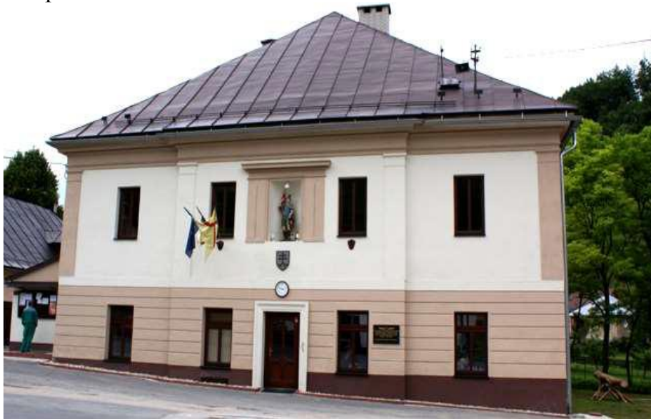
Obrázok 1 Obecný úrad v Tajove