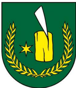
Obrázok 3 Erb obce Klin nad Bodrogom