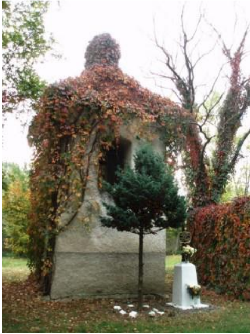
Obrázok 7 Zvonička

Pri kostole stojí jednoduchá murovaná zvonica na pôdoryse štvorca so segmentovo V areáli terajšieho obecného úradu sa nachádza hrobka zemepánov Kossuthovcov.