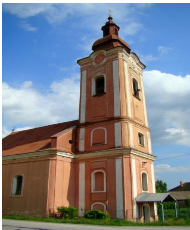
Evanjelický kostol v časti obce Jelšavská Teplica