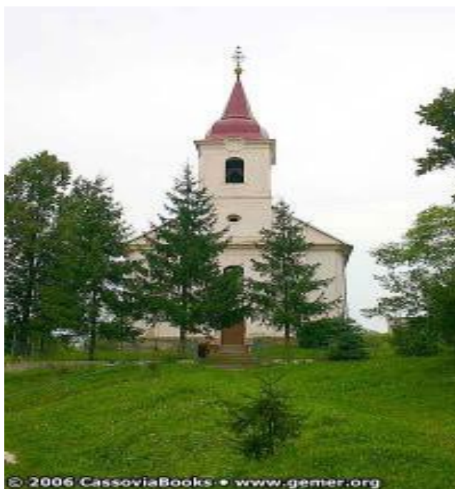
Evanjelický kostol v časti obce Gemerský Milhošť