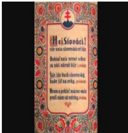
Hej Slováci – hymnická pieseň