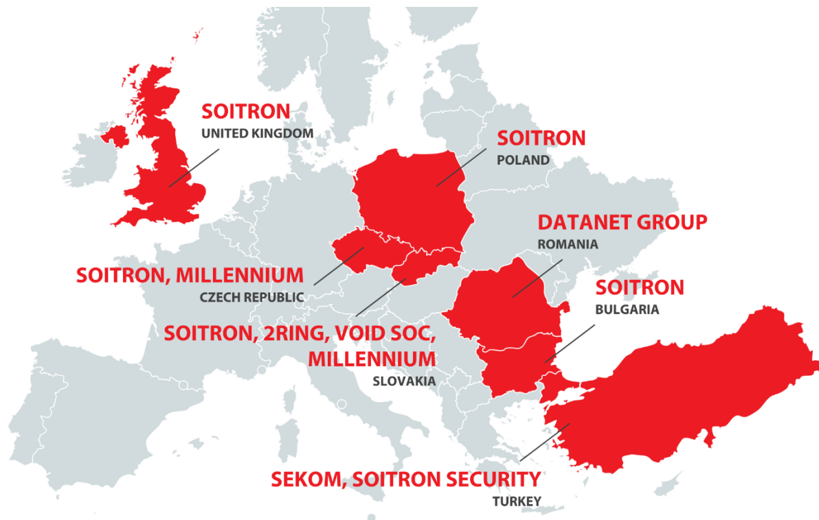
Obr. Vyobrazenie jednotlivých dcérskych spoločností Soitron Group SE