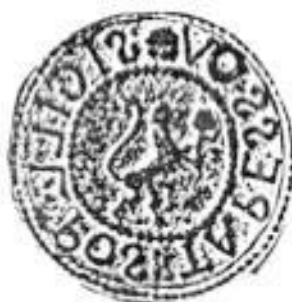
Obr. 3 – Pečať obce Ťapešovo

Pečať obce Ťapešovo je okrúhla, uprostred s obecným symbolom a kruhpisom OBEC ŤAPEŠOVO.