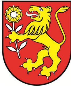
Obr. 1 – Erb obce Ťapešovo

Erb obce Ťapešovo pozostáva z motívu zlatého leva, ktorý drží striebornú ružu a stojí v červenom poli.