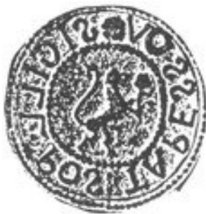
Obr. 3 – Pečať obce Ťapešovo

Pečať obce Ťapešovo je okrúhla, uprostred s obecným symbolom a kruhpisom OBEC ŤAPEŠOVO.