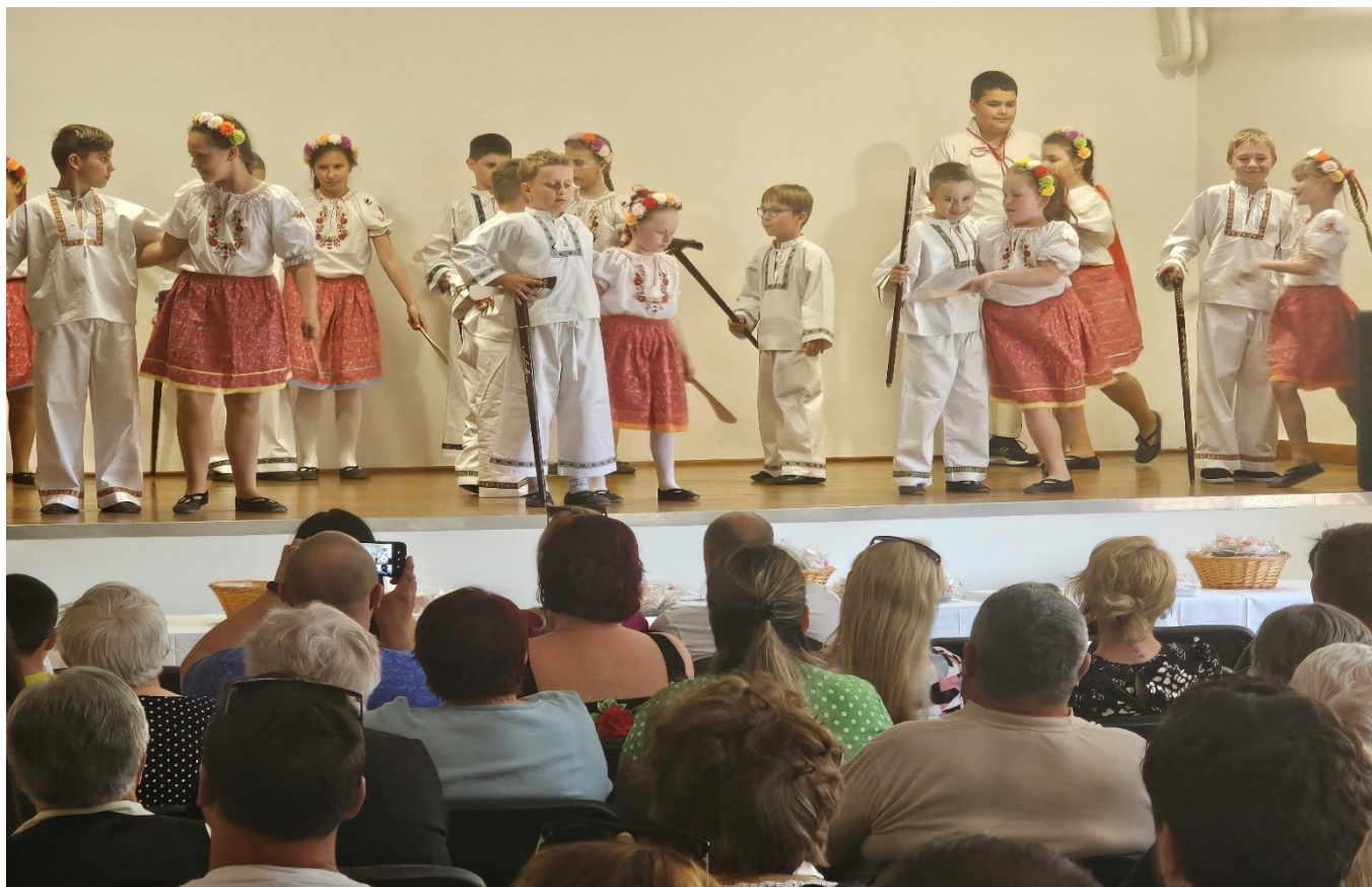
Tradičná slávnosť „Váľanie Mája“ prebehla na začiatku mesiaca jún