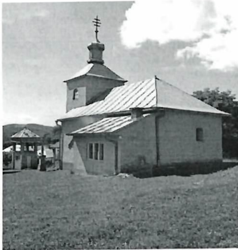
Dedáčov - Narodenie Presvätej Bohorodičky, 1800