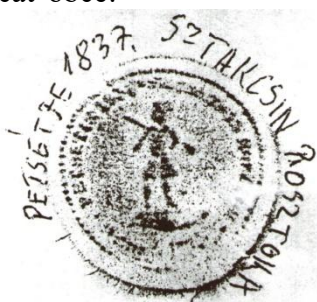
Pečať z roku 1837