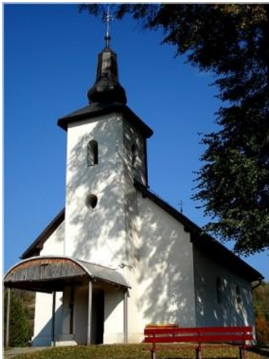
- Zvon z roku 1868