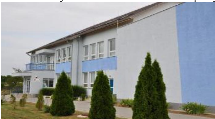
Základná škola Juraja Holčeka

V súčasnosti výchovu a vzdelávanie detí v obci poskytuje: