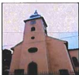
Obrázok č. 7

V súčasnosti sa jedenkrát do roka v kostole konajú Služby Božie za účasti evanjelických veriacich z okolitých obcí a potomkov bývalých nemeckých občanov obce.