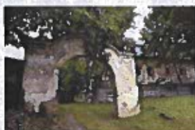
Obrázok č. 9

Presné údaje o tom, kedy bol Toporecký kaštieľ postavený nie sú známe, ale vyplývajú z faktov, že Toporec bol od prelomu 13./14. stor. sídlom rodu Görgeyovcov, je možné predpokladať, že najstaršia časť kaštieľa mohla pochádzať ešte zo začiatku 14. stor. Postupný stavebný vývoj kaštieľa nie je doposiaľ známy, nakoľko sa na objekte neuskutočnil archeologicko-architektonický výskum, ktorý by pomohol odhaliť dejiny objektu.