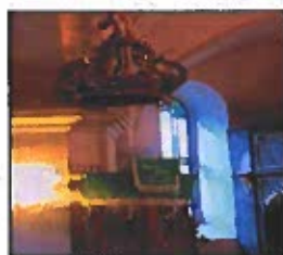
Obrázok č. 8