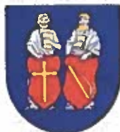
Obrázok č. 4

Erb obce: v modrom štíte dva červené štíty, v prvom zlatý kríž, v druhom zlatý súkenický slák, za štítmi sú ako nosiči strieborní zlatovlasí sv. Filip a sv. Jakub ml., každý drží na hrudi zlatú knihu.