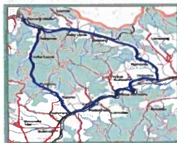
Obrázok č. 3

Toporec je potočnou radovou dedinou. Dominantu obce tvoria katolícky a evanjelický kostol a dva kaštiele Gőrgeyovcov. Stredom obce preteká potok Topor, od ktorého je odvodené aj pomenovanie obce. Podľa súčasného územnosprávneho členenia patrí obec do okresu Kežmarok. Chotár Toporca hraničí na juhozápade s Podhoranmi, Vojňanmi a Slovenskou Vsou, na severe s Veľkou Lesnou a Veľkým Lipníkom, na východe s Vyšnými Ružbachmi a Podolíncom a na juhu s Holumnicou. Chotár je kopcovitý v nadmorskej výške 600-750 m. Zvláštnosťou chotára boli početné pramene kyseliek, ktoré obyvatelia veľmi radi pili.