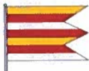
Obrázok č. 5

pozostáva zo siedmich pozdĺžnych pruhov vo farbách žltej, červenej, bielej, červenej, žltej, červenej a bielej. Vlajka je ukončená tromi cípmi.