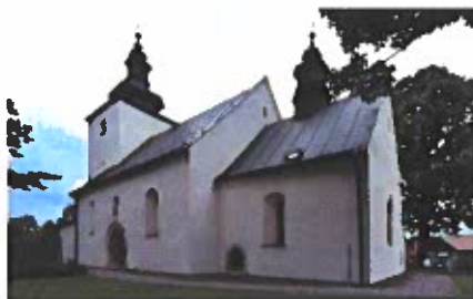
Obrázok č. 6

Sakrálny objekt bol vybudovaný na menšej vyvýšenine (573 m n. m.) zarovnannej terasy Toporeckého potoka, na južnom okraji Spišskej Magury. Stavba vznikla v rámci významného