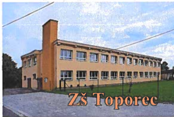
Obrázok č. 12

➤ Základná škola Toporec, Školská 7/6, 059 95 Toporec