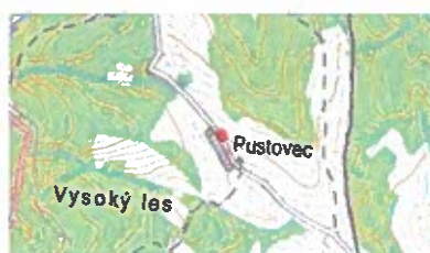
Obrázok č. 11

V miestnom kostole na ich rodinnom erbe z prvej polovice 17. storočia je vyobrazený symbol - lípový strom.