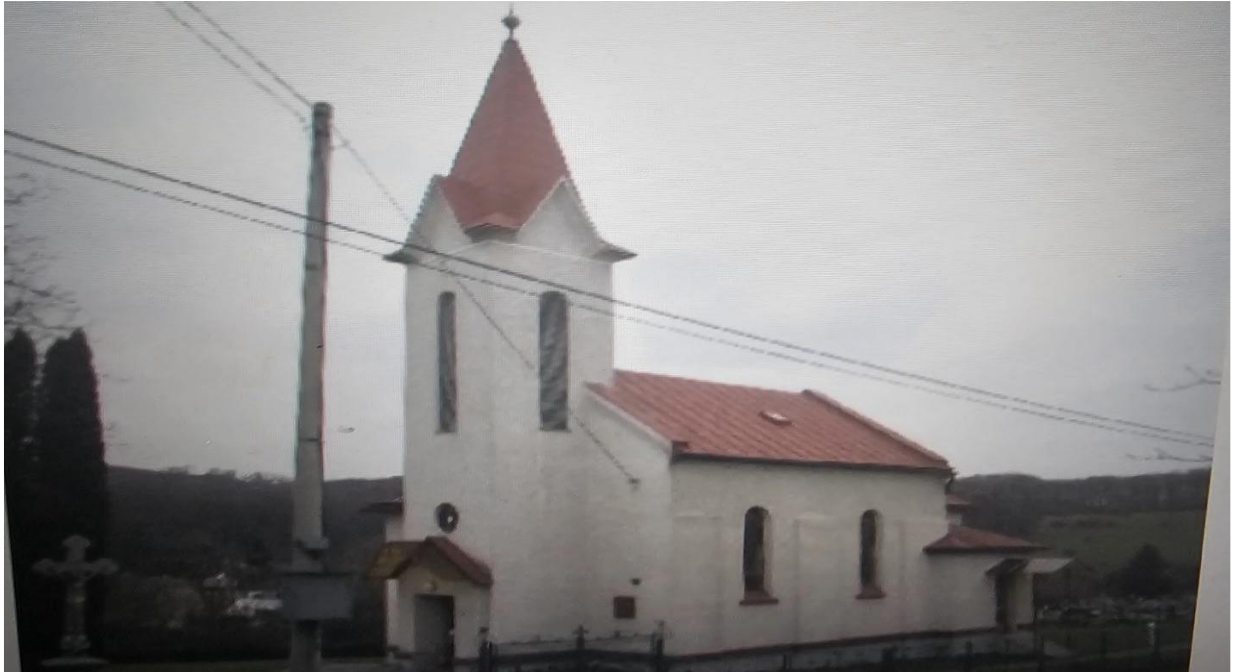
Rímsko-katolícky kostol "Nanebovstúpenia Pána"