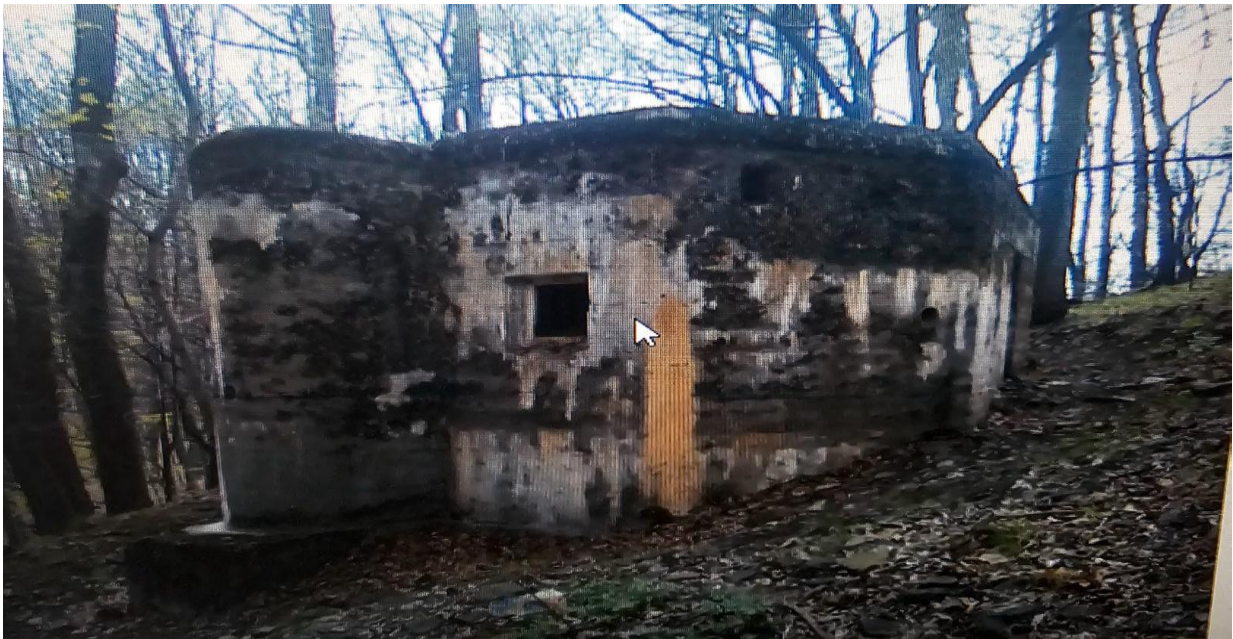
Pozostatky guľometného bunkra

Za I. ČSR ( Československej republiky ) obyvatelia pracovali v lesoch a poľnohospodárstve. Za bojov 1944 bola obec 6 týždňov vo frontovom pásme a utrpela značné škody. JRD založili 1958. Väčšina obyvateľov pracuje v priemyselných podnikoch v Košiciach. Po podpísaní Viedenskej arbitráže, Nový Salaš zostal súčasťou Československa. Vzhľadom na blízkosť hraníc Horthyovského Maďarska tu v rokoch 1938 – 1939 vybudovali pás betónových guľometných bunkrov vedúcich aj cez Slanskú Hutu, z ktorých deväť sa zachovalo v dobrom stave dodnes.