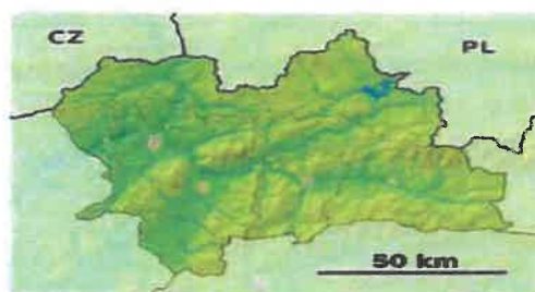
Poloha obce v rámci Žilinského kraja