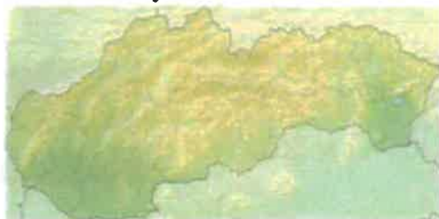
Poloha obce na Slovensku