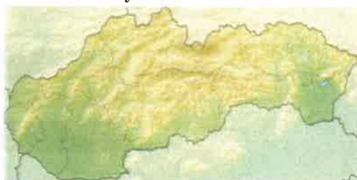
Poloha obce na Slovensku