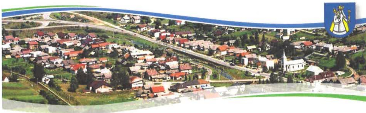
Pohľad na Ľubotín