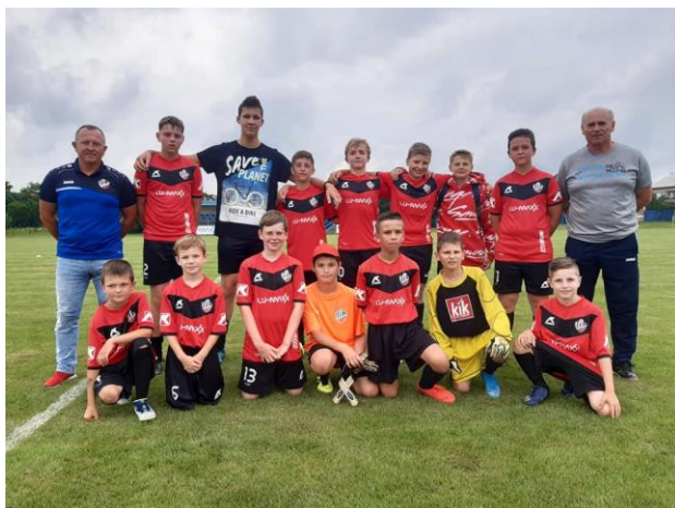
Účastníci športového futbalového kempu.

Obecný futbalový klub Perín organizoval v mesiaci júl týždenný športový futbalový kemp pre deti a mládež na miestnom futbalovom ihrisku s profesionálnymi trénermi a nabitým programom. Futbalový kemp ukončili v sobotu akciou „Športový deň“, ktorá bola pre všetkých občanov. Futbal si zahrali deti, mládež, A – mužstvo a následné aj „horný koniec“ proti „dolnému koncu“. Nafukovací skákací hrad, trampolína a program pre deti nesmel chýbať. O gul'áš sa postarali futbalisti a organizátori, nasledovala už iba tancovačka pod holým nebom.