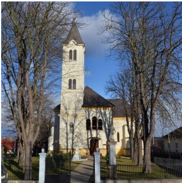
Rímskokatolícky kostol v Períne