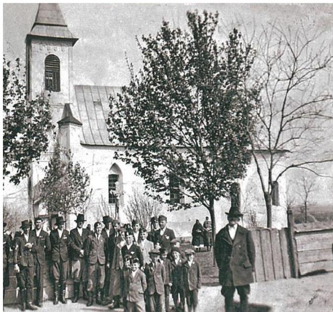
Rímskokatolícky kostol v Chyme okolo roku 1941

Rímskokatolícky kostol sv. Štefana v Chyme - jednolod'ová gotická stavba so segmentovým ukončením presbytéria a predstavanou vežou z konca 13. storočia.