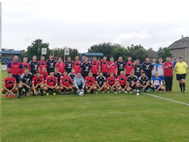
Futbalisti zápasu „Horný kopec proti dolnému kopcu“