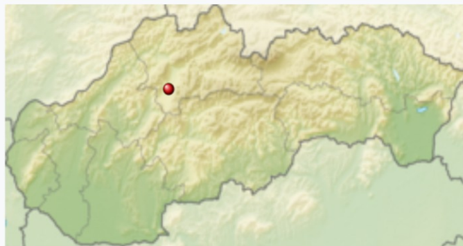
Poloha obce na Slovensku