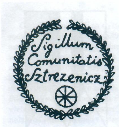
Historická obecná pečat' Streženíc

Najstaršia zachovaná obecná pečat' nemá datovanie. Použitá bola v roku 1860. Priemer pečate je 30 mm. V dolnej časti pečatného poľa je malé koleso voza, nad tým je kurzivou v troch riadkoch legenda: Sigillum Comunitatis Sztrezenicz . Vonkajší okraj pečate tvorí široká listovka. Odtlačok nedatovaného typára je uložený v Ústrednom archíve geodézie a kartografie v Bratislave.