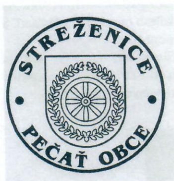
Obecná pečat' s kruhopisom

Pečat' obce je okrúhla, uprostred s obecným symbolom a kruhopisom OBEC STREŽENICE s priemerom 35 mm.