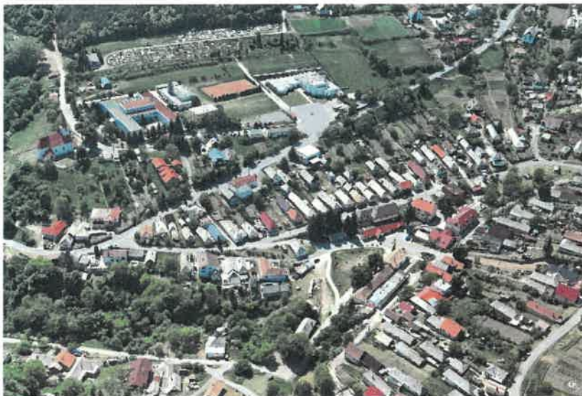
Letecký pohľad na centrum obce Hrušov

Obec Hrušov sa nachádza na južných svahoch Krupinskej planiny, v západnej časti okresu Veľký Krtíš. Obec predstavuje zlomovú obec medzi slovensky a maďarsky „hovoriacimi dedinami“ v tejto časti okresu. Na juhu a západe hraničí s obcami Vinica, Kleňany, Plášťovce, na severe a východe s obcami Cerovo a Čelovce. Nadmorská výška v strede obce je 380 m n. m. a v chotári 200–524 m n. m. Vzdialenosť od okresného mesta Veľký Krtíš je 32 km.