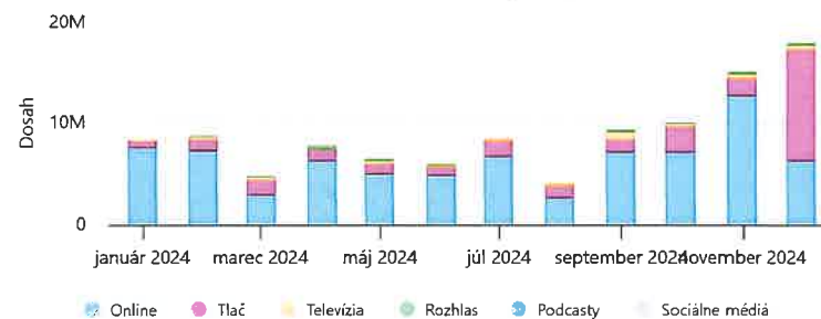
Advertising Value Equivalent (AVE) pre tému: Nadácia DEDO

za obdobie od 1. 1. 2024 do 31. 12. 2024