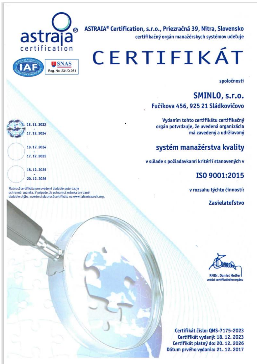
Obrázok 1: Certifikát riadenia kvality ISO 9001:2015