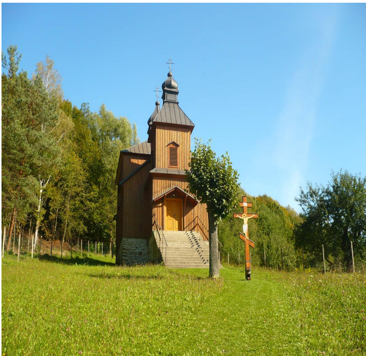
Obrázok 3 Pravoslávny chrám sv. veľkomučenika Dimitrija Solúnskeho

Ďalším menej známym a navštevovaným miestom je vojnové pohrebisko z 1. svetovej vojny, ktoré sa nachádza na obecnom cintoríne. Pohrebisko bolo zriadené v roku 1922 po vykonaných exhumáciách a tvorí ho 43 hrobových miest. V 38 hroboch je pochovaných 58 príslušníkov 10. jazdeckej divízie 3. cárskej ruskej armády, ktorí na území obce viedli, po prekročení štátnej hranice a karpatských hrebeňov, od septembra 1914 do apríla 1915 bojovú činnosť. V ďalších 5 masových hroboch sú uložené ostatky 58 neidentifikovateľných tiel. Pohrebisko je označené iba pamätným dreveným krížom.