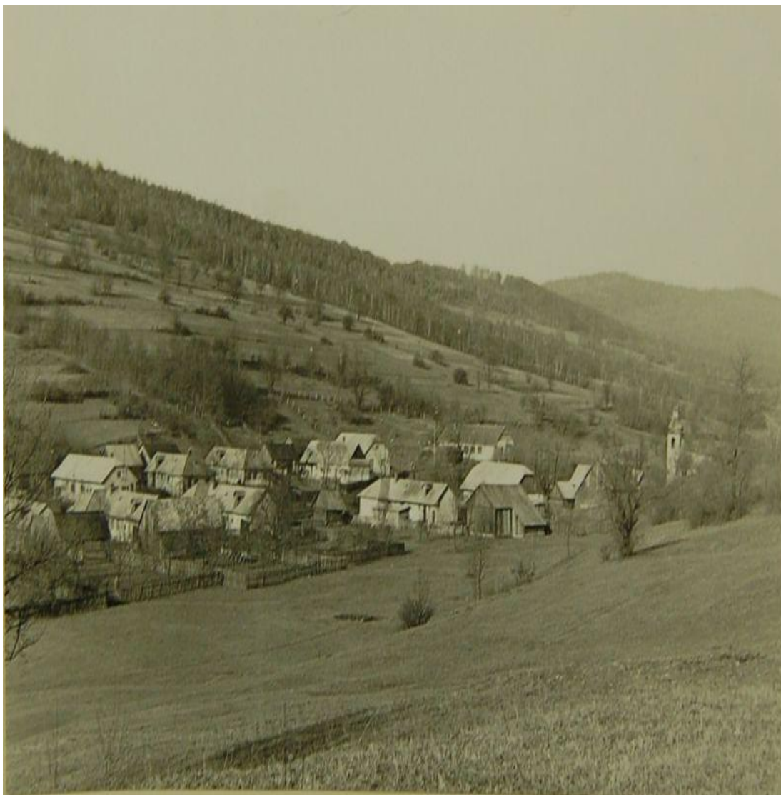
Obrázok 2 Obec v období 50-tych rokov

Do okolitých obcí ľudia v tom čase chodili pešo alebo na vozoch. To sa však začalo meniť od roku 1951, kedy do obce zavítal prvý autobus. V roku 1954 bol na policajnej stanici namontovaný prvý telefón, ktorý slúžil aj občanom obce a vďaka nemu bolo možné včas zavolať doktora či sanitku. Ďalší zlom nastal 10.10.1959, kedy bol do obce zavedený elektrický prúd. V tom istom roku bola v obci zriadená pošta, ktorá sídlila v školskej budove a neskôr v rodinnom dome. V roku 1968 sa začala rekonštrukcia vojnou poškodeného gréckokatolíckeho chrámu postaveného v roku 1937. Rekonštrukčné práce boli dokončené v roku 1971.