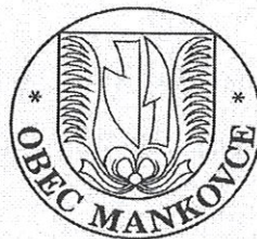
Pečať obce :