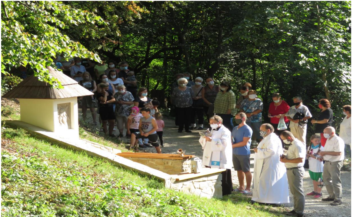
Cesta 7 radostí a 7 bolestí Panny Márie