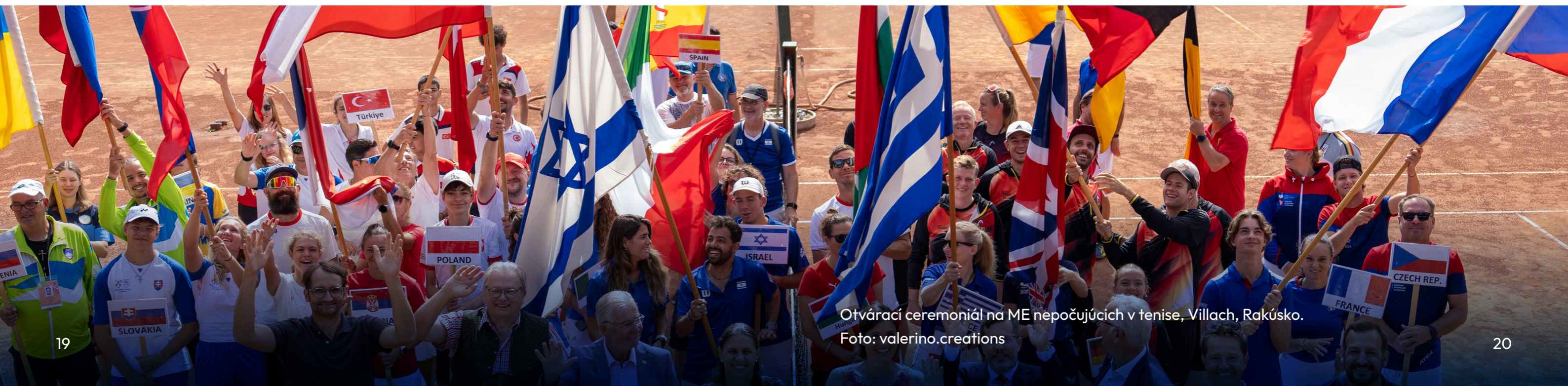
Otvárací ceremoniál na ME nepočujúcich v tenise, Villach, Rakúsko.