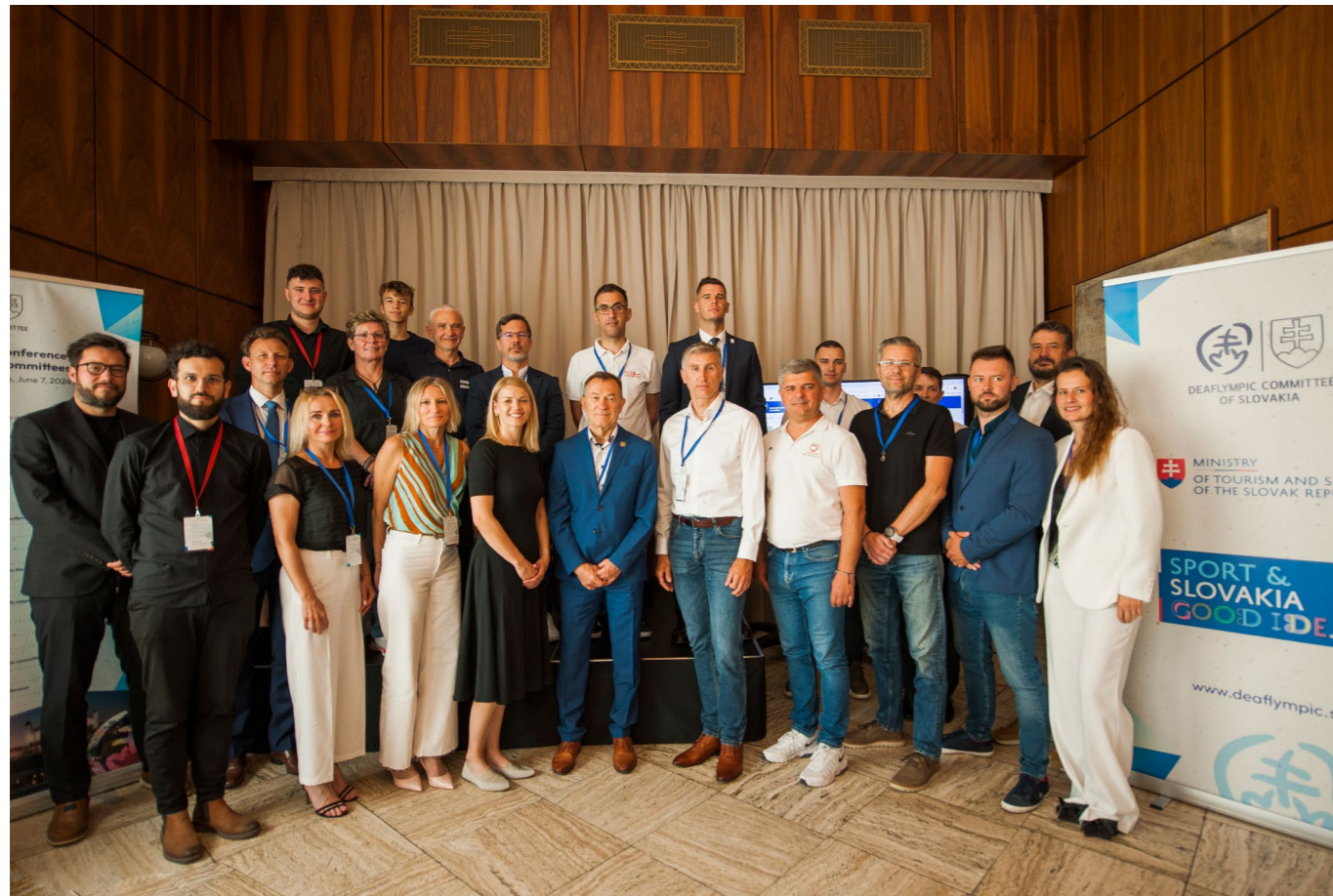
Medzinárodná konferencia deaflympijských výborov, Hotel Devín, Bratislava.