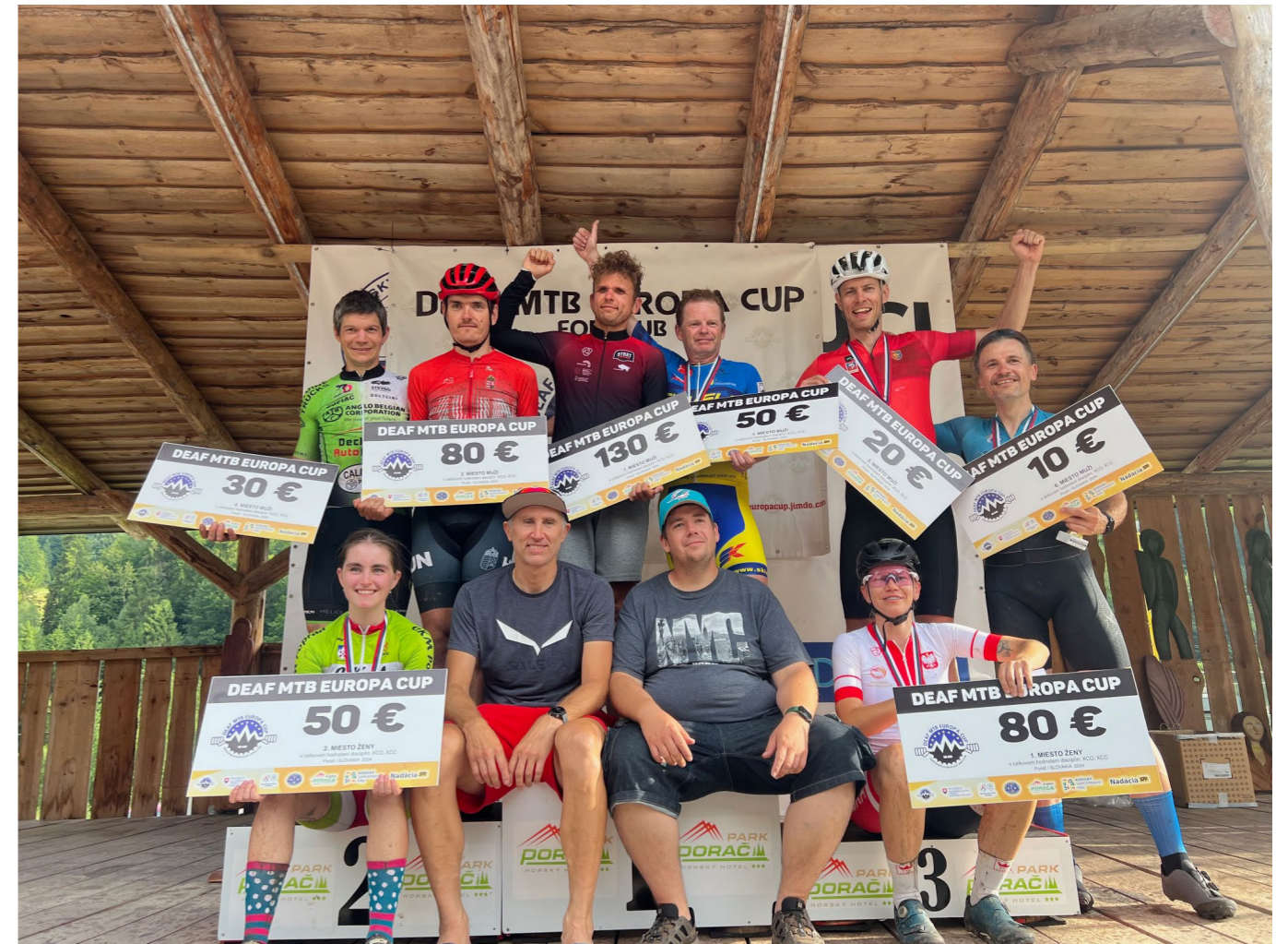
DEAF MTB EUROPA CUP, Porač, Slovensko.