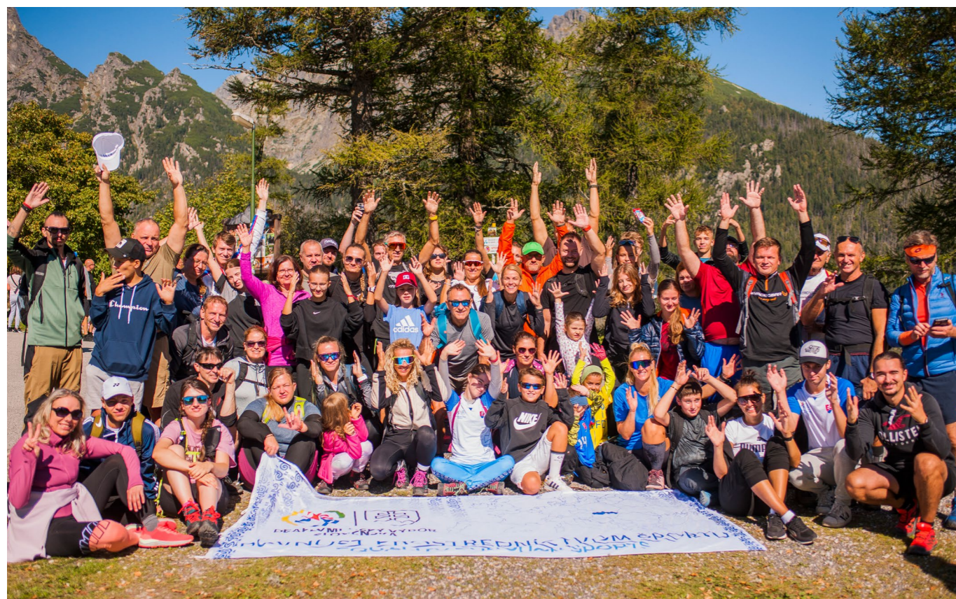
Spoločný výstup k Vodopádom Studeného Potoka, Deaf Tatry 2024.