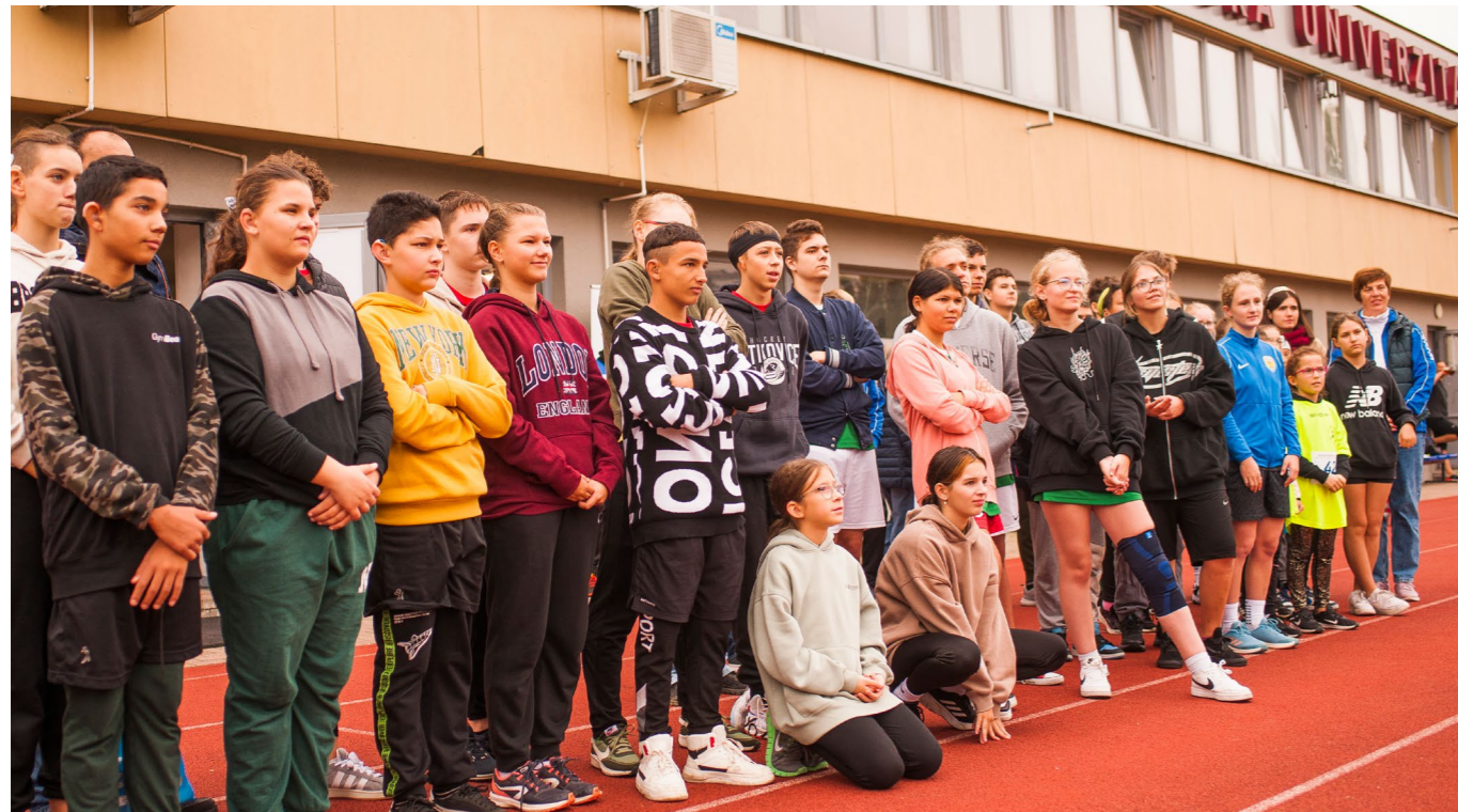
DEAFLYMPIJSKÉ DNI 2024.

Majstrovská súťaž celoslovenského charakteru organizovaná DVS pre nepočujúce deti a mládež zo špeciálnych ZŠ a SŠ z celého Slovenska (viac ako 80 účastníkov) v atletike a stolnom tenise. Toto podujatie zrealizovalo DVS s finančnou podporou Bratislavského samosprávneho kraja s celkovou výškou dotácie 2500 eur.