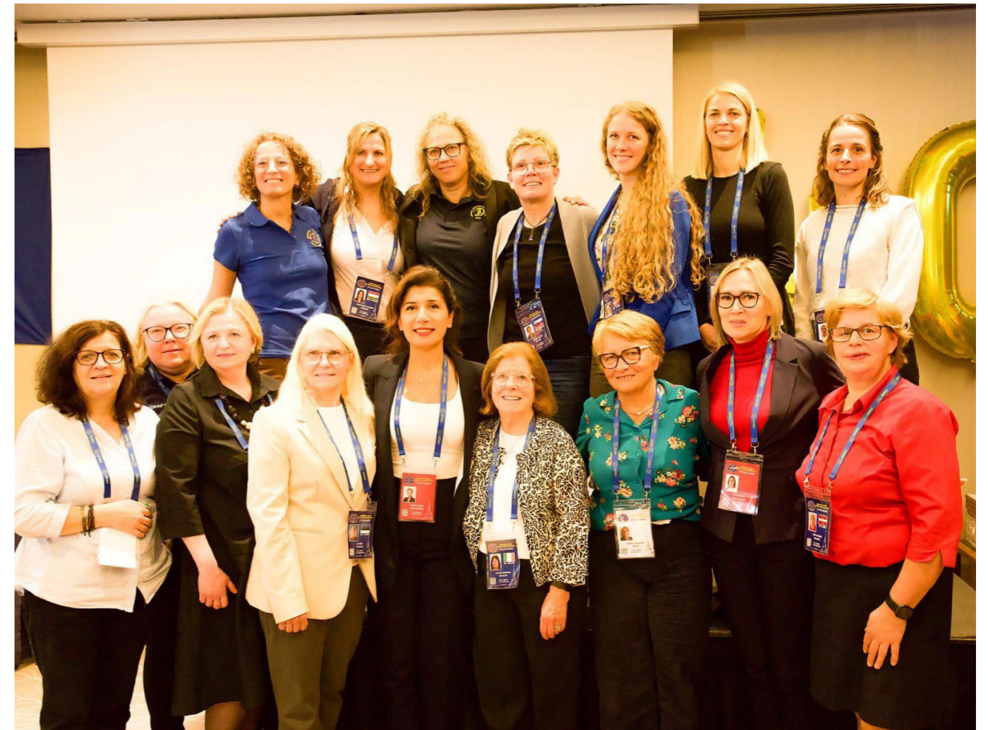
22. kongres EDSO, Paríž 2024.