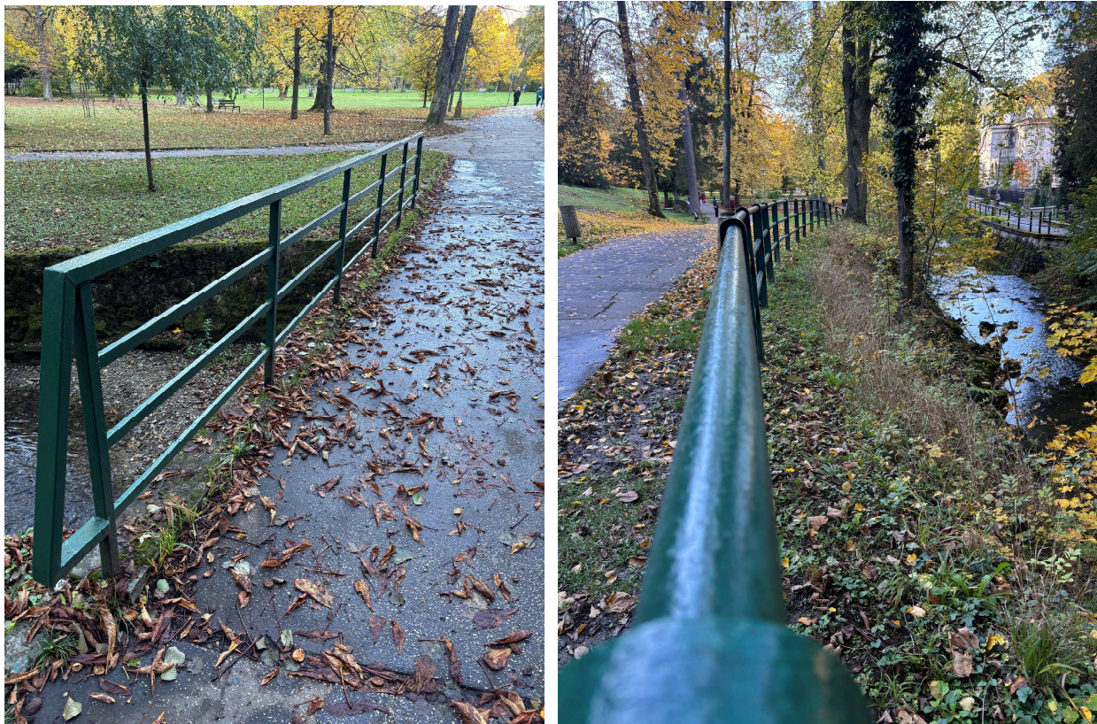
Náter zábradlia v Kúpeľnom parku v Trenčianskych Tepličiach.

V roku 2025 prijala nezisková organizácia podiel zaplatených daní vo výške 5 957,73 €, ktoré budú použité v roku 2026.